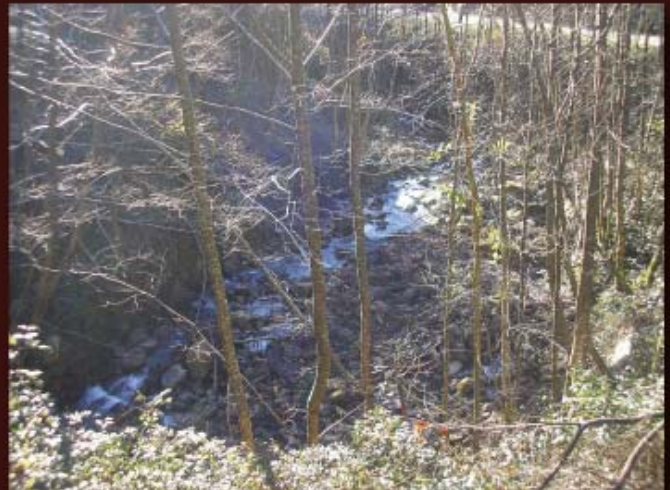
Aspecto del río Callejamala desde la parte superior del pretil de la margen izquierda.