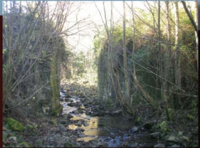
Los dos pretils del puente semiocultos por la vegetación.

El entorno es de alto interés ecológico, por la presencia de un bien conservado ecosistema de ribera, y en medio de los dominantes cultivos de eucalipto.